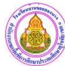
ตราสัญลักษณ์ โรงเรียนบ้านข่อยสองนาง